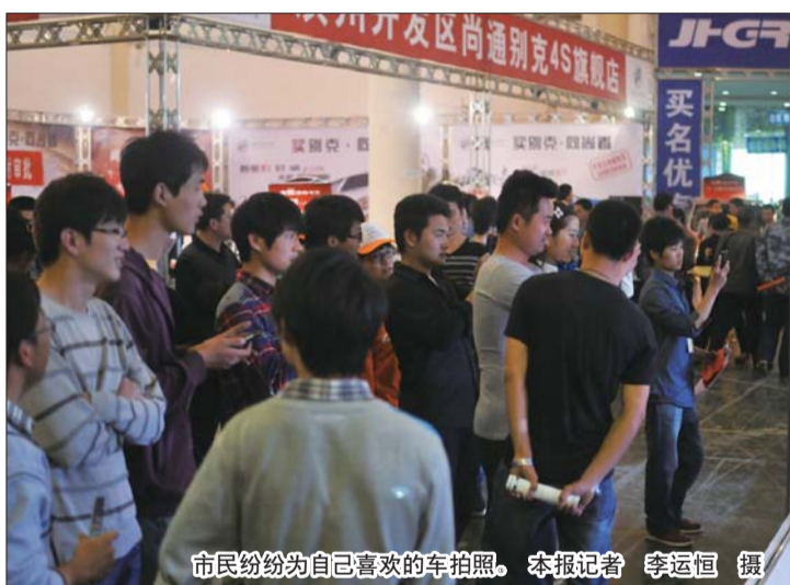
市民纷纷为自己喜欢的车拍照。

车展茫茫人海中,你我擦肩而过或许也不曾相识,却怀揣着同一个梦想——拥有一辆心爱的汽车。有买上属于自己的汽车而激动相拥的,有暗暗下决心为买车而努力奋斗的,这些像一场场励志电影。无论承认与否,梦想已经起航!