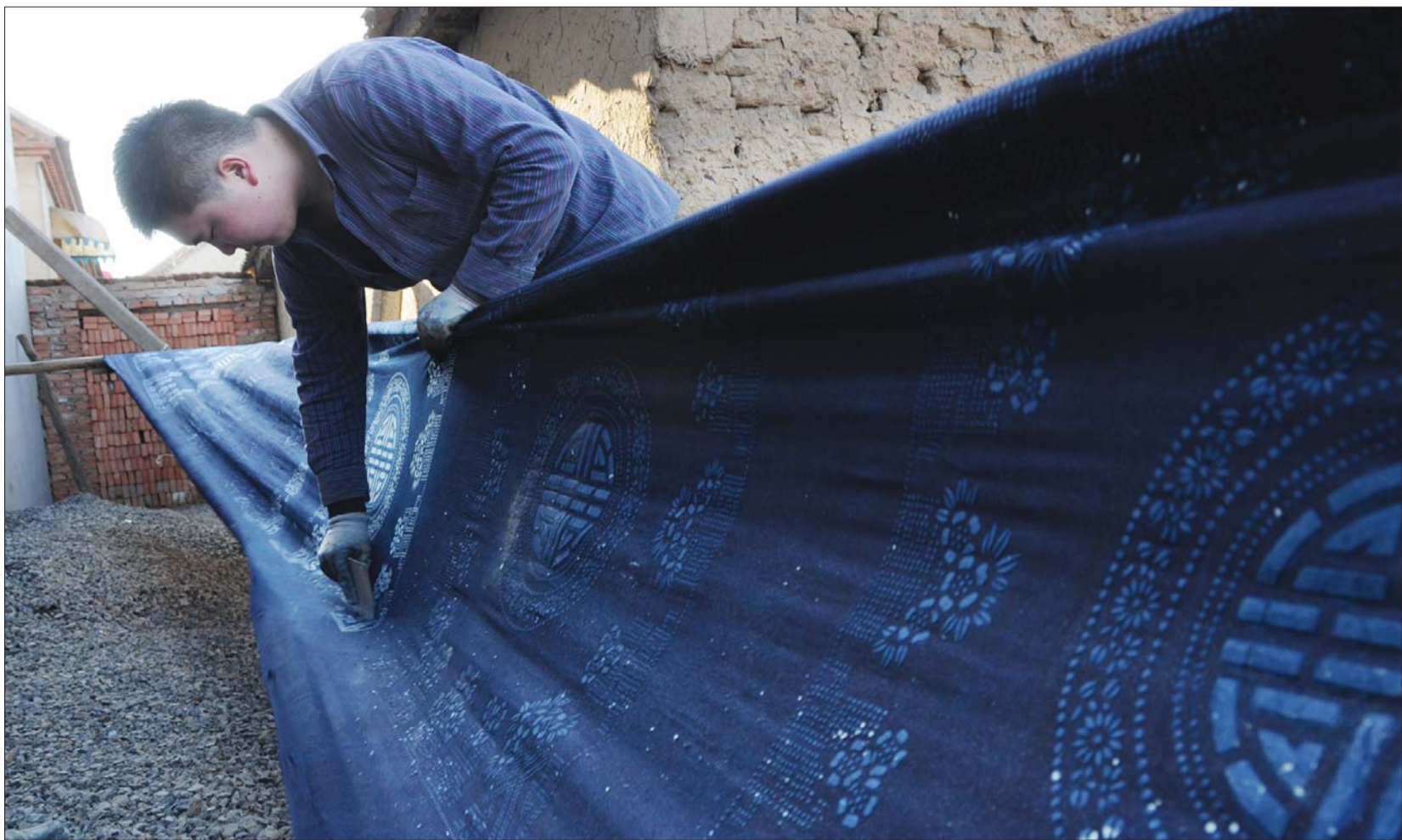
▲蓝布晒好后,将防腐剂刮掉,精美的白花就呈现在蓝布上。