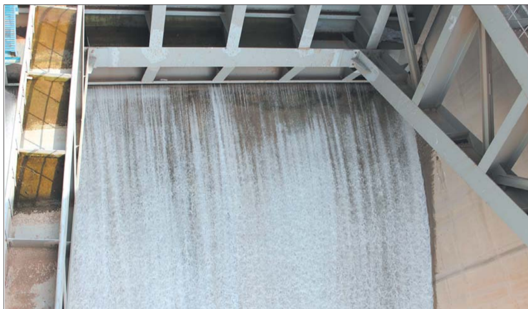
15日下午,随着闸门缓缓升起,卧虎山水库开始放水补泉。图为开闸瞬间,库水喷涌而出。

本报4月15日讯(记者 修从涛 实习生 刘旭 王慧) 15日,趵突泉水位为28.19米,逼近黄色警戒线28.15米。为保持泉水喷涌,15日下午,卧虎山水库正式启动回灌补源,日放水量20万立方米,预计将持续放水一个月左右。据了解,此次回灌补源一方面为了保泉,另一方面还可为南部山区的60万亩农田补充灌溉水源。