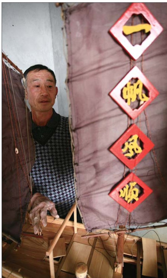
船帆上的一帆风顺预示着渔民对美好生活的期许。

黄花船又名大风船,是一种盛行在上世纪二三十年代的有桅帆船,当时北方沿海渔民都是驾驶这种渔船出海捕捞黄花鱼。