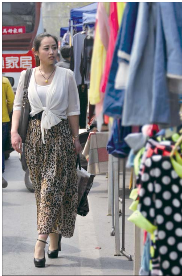
▲15日,在张店柳泉路与共青团西路路口一名市民已经穿上裙子。

据了解,除3月份平均气温较常年偏高创多项历史新高外,其他几个月份的气温整体偏低。1、2月较常年偏低;3月中旬至4月上旬旬平均气温均较常年偏低,气温回升缓慢。