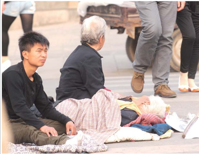
15日下午5时,三名乞丐在济南一路口乞讨,老汉躺着老太跪着,小男乞丐一脸凝重。

天气转暖,城市街头的乞丐又多起来,其中一些残疾老年乞丐很容易引起人们的同情。然而,一些职业乞丐正是利用了人们的同情心,做戏扮可怜,博取同情骗人钱财。