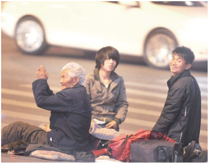
15日晚上8时许,老汉和老太“换了班”,小男乞丐则对着记者扮起了鬼脸。