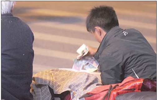
15日20时30分:小男乞丐迅速拿走桶中的钱。