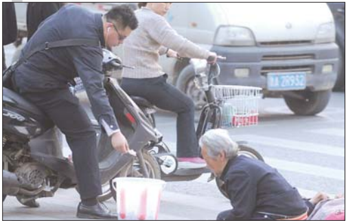
15日15时许:很多行人慷慨解囊。