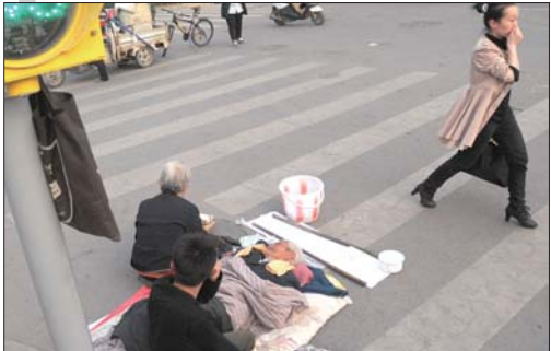
15日15时:这几名乞丐在历山路一路口乞讨。