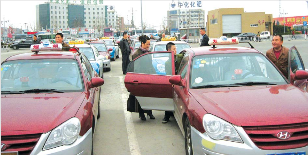
16日,进站出租流水发车,市民打车更方便了。