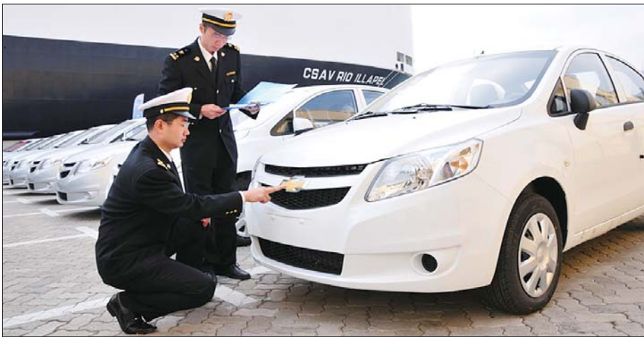
烟台海关官员在港口监管出口汽车。

政府和企业应该怎么应对如此严峻的国际外贸形势?2013年烟台商务工作要点将外贸工作目标定为:实际使用外资增长8%,外贸进出口增长5%,这个目标又该怎么尽快实现?