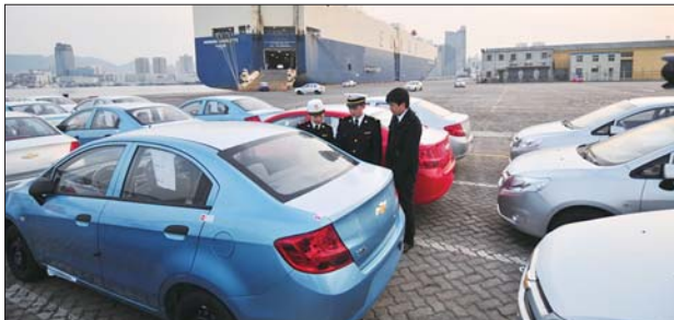
烟台海关官员在烟台港码头现场检验出口汽车。