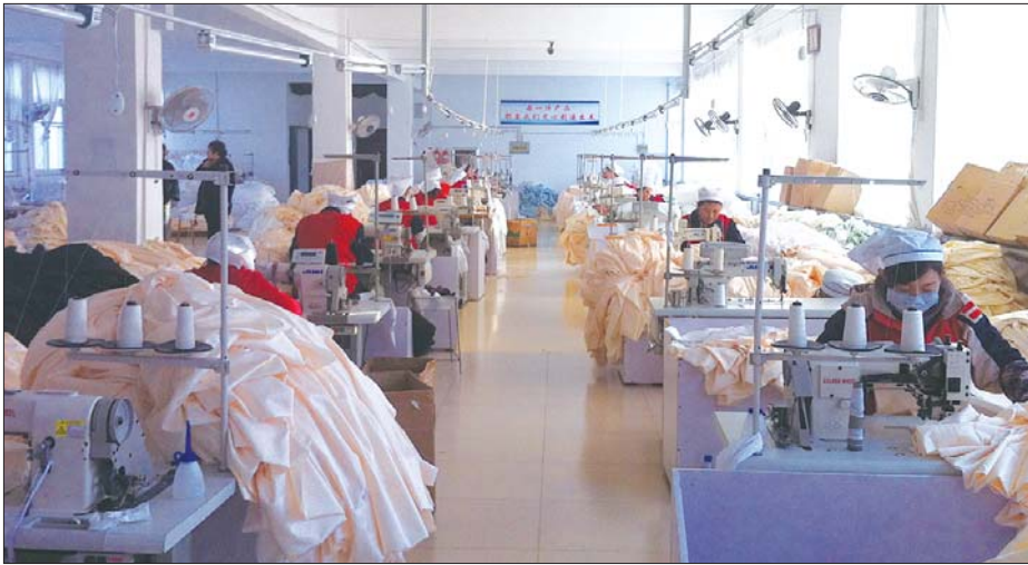
一家外贸出口企业的工人正在赶制一批订单。