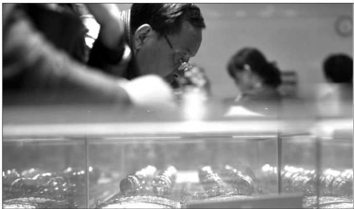
齐鲁金店里,前来挑选黄金饰品的市民络绎不绝。