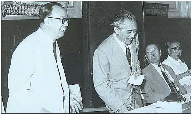
晚年的胡适(中)与梁实秋(左)

月8日中午抵达青岛，他此行有三个任务：一是参加中国科学社年会；二是出席国立青岛大学开学典礼；三是参加中华教育文化基金会会议，为成立不久的编译委员会物色翻译外国文学名著的人选（胡适时任中华教育文化基金会编译委员会主任）。