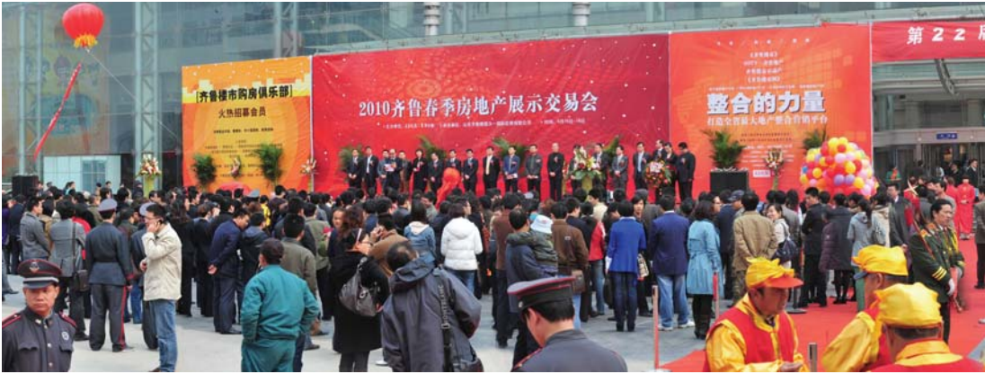
2010年齐鲁春季房展开幕式现场