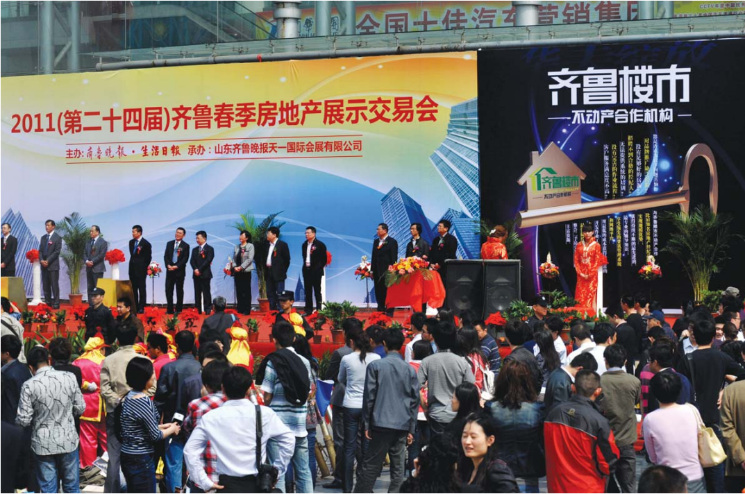
2011年齐鲁春季房展会开幕式现场

项目区位优势优越,交通便利,配套齐全。5分钟即可抵达高新区核心利群商圈,10分钟抵达市中心及大润发商圈,30分钟可抵达威海机场。周边临近三大海水浴场,景色秀美。拥有便利的教育、医疗等配套,临近山大威海分校、哈工大威海分校。中韩自由贸易区,青烟威一小时生活圈,借力半岛蓝色经济发展机遇,凭借得天独厚的稀缺资源以及新贵族生活理念,打造中国首席滨海奢尚湾居。