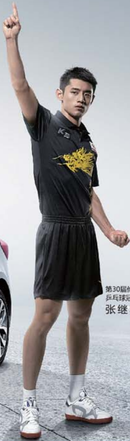
第30届伦敦奥运会 乒乓球冠军 张继科