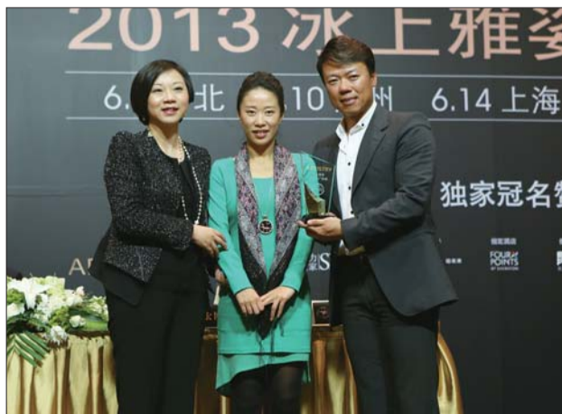
雅姿品牌总监汤梅(左)向奥运冠军申雪赵宏博夫妇颁赠“冰上雅姿推广先锋”奖座。

2013年“冰上雅姿”盛典,艺术总监申雪、赵宏博带领花滑世界冠军阵容再次突破升级,力邀明年冬奥会男单夺冠热门,加拿大花滑锦标赛最年轻的金牌得主,以破竹之势横扫各大赛事金牌的华裔花滑冠军陈伟群,加拿大“花滑天才”科特·布朗宁、