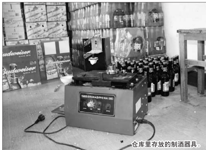
仓库里存放的制酒器具。

经审讯,该窝点售出的假冒伪劣洋酒、啤酒大多销往城区夜晚娱乐场所及地摊烧烤等地方。目前,滨城警方已将这批假酒、假商标和作案工具全部予以扣押,案件正在进一步调查中。