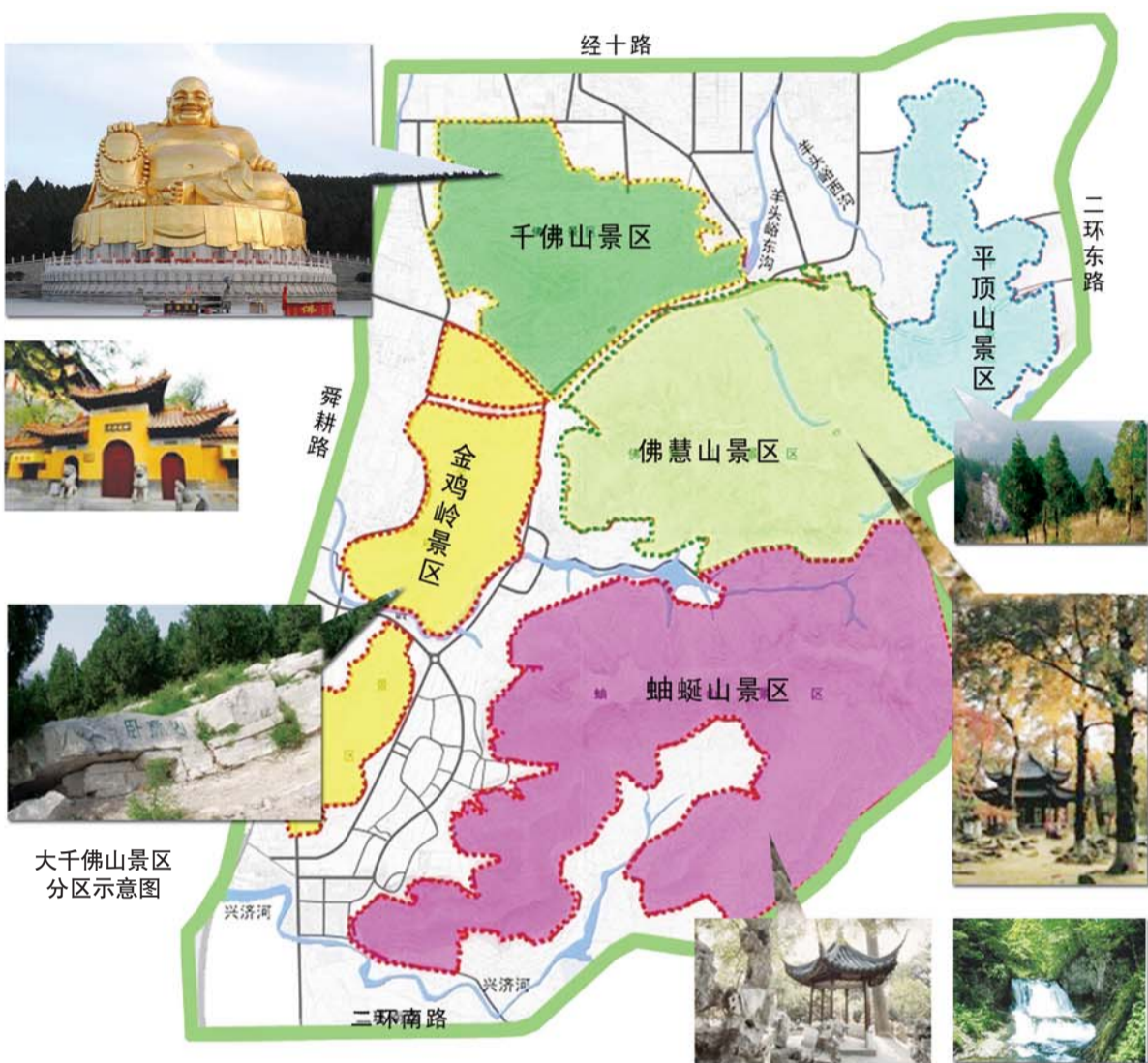
大千佛山景区分区示意图

另外,大千佛山风景区还设有五个主要出入口,分别为千佛山景区北门、开元寺入口、英雄关入口、扳倒井大门、东外环大门,另有多处辅助入口,主要入口将根据情况设停车场。