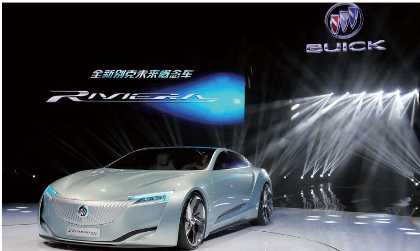
▲全新Riviera别克“未来”概念车

设计上，全新Riviera别克“未来”概念车对现有别克“动感流畅”的产品设计DNA予以大跨度延展，并将前瞻科技、人性化功能与现代美学完美相融，优雅、简约、精致和高效，成