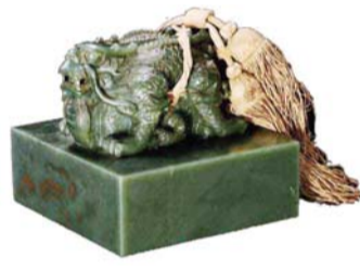
▲清嘉庆“嘉庆御笔之宝”交龙钮碧玉宝玺