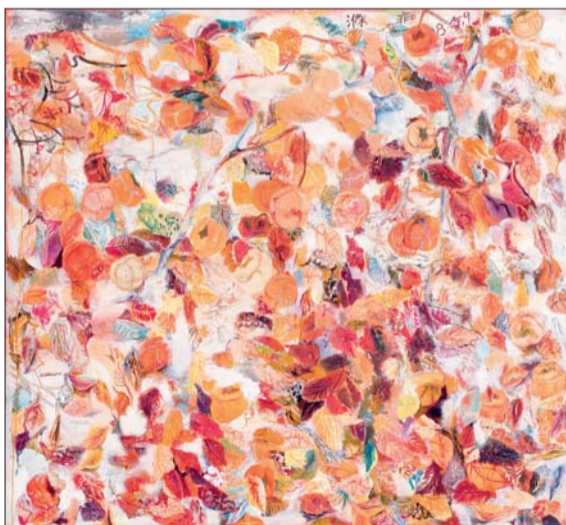
▲贾涤非《叶子》2008年创作

据了解,中国书画专场实行“平民化”的无底价拍卖,将成为此次拍卖会的亮点之一。当代油画专场则集中了忻东旺、徐唯辛、贾涤非、孙为民、闫平、王克举、戴士和、俞晓夫、朱伟、段建伟、谢东明等当代著名油画家的部分代表性作品。这些作品直接体现出中国当代油画艺术的表现语言和审美诉求,折射中国当下的社会生活和文化心理。尤其是人物题材的作品,因表现力强,特