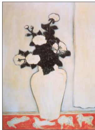
▲常玉《白牡丹》1930年创作

本报讯(记者 霍晓蕙 实习生 赵娜)日前,两场学术氛围浓郁的油画展作为2013春秋拍卖的前奏,在济南成功举办。据了解,即将于4月24日在山东新闻大厦举槌(22日、23日预展)的2013年山东春秋艺术品拍卖,定位于中国当代艺术尤其是名家油画,力求以高端拍品来拓展中国艺术市场“正能量”。