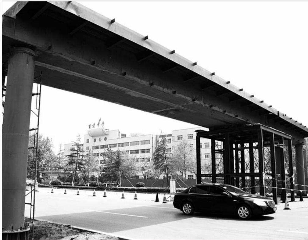
正在建设的过街天桥。

本报济宁4月21日讯(记者 王洪磊) 21日,育才中学过街天桥已架起钢结构主桥。记者了解到,过街天桥的整个钢结构主桥将于近两日搭建完毕。此前计划设计的挡雨棚和电梯因故被取消。