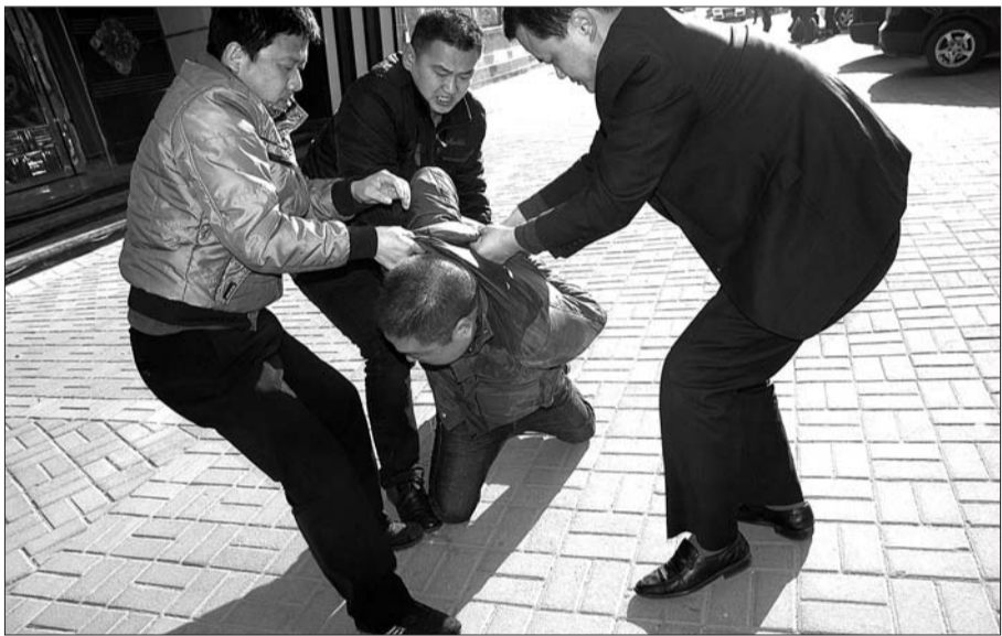
警方蹲守一夜后,将走出洗浴中心的犯罪嫌疑人一举抓获。

光天化日,曹县一家砂石料场的三个保险柜被撬,案发现场,只有一辆皖牌三厢轿车频繁出没,监控视频中,嫌疑车车牌难辨真伪。曹县警方经缜密侦查,充分利用多种信息化手段巡线追踪,辗转河南、安徽、江苏、山东、河北五省,行程4000余公里,成功打掉这一流窜撬盗保险柜犯罪团伙。