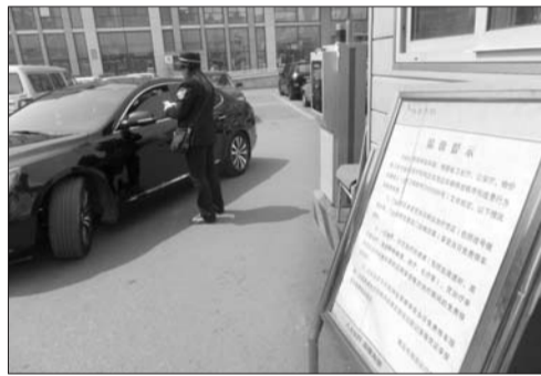
在海慈医院门口,一辆汽车正开出医院。

18日,青岛市卫生局下发《关于加强医疗机构免费停车管理工作的通知》。21日,岛城多家医院已对新的免费停车规定进行公示,部分医院还根据自身情况对新规的部分内容做了变通。对于“一小时内免费停车”这一新政策,医院和患者家属均表示符合实际情况。