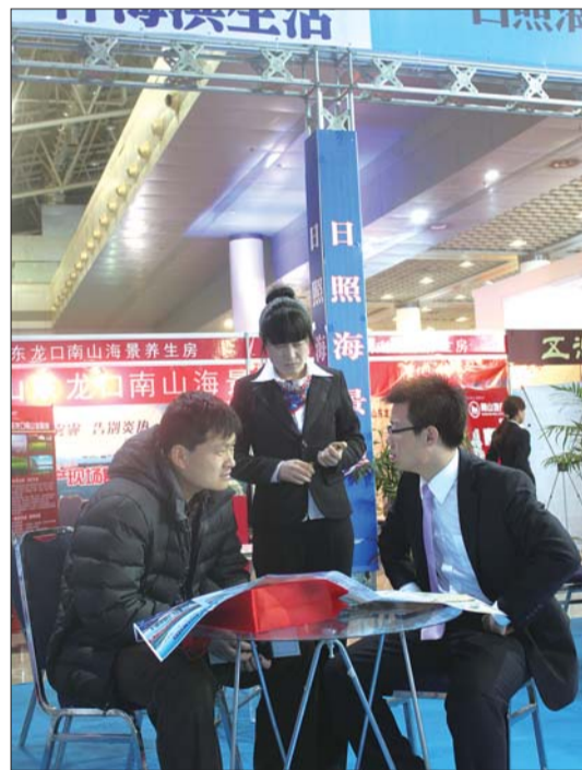
置业顾问详细跟客户介绍项目情况。