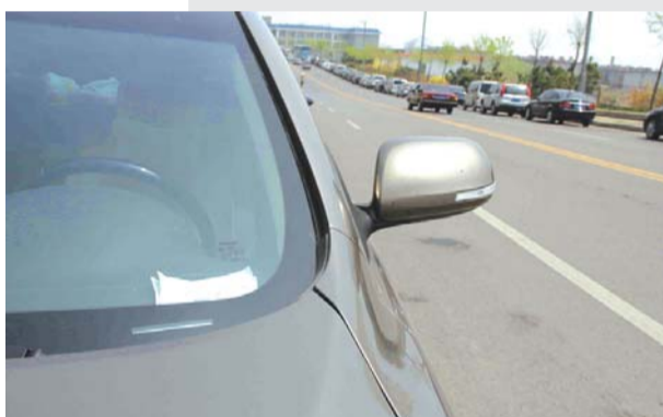
▲停车场工作人员在现场看车。 ◀缴费的车辆里,放着收费发票。