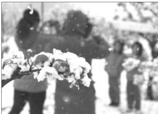
四月降雪使得花朵更加好看,引来不少市民拍照。