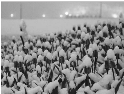
中海的郁金香在雪下更加娇媚。

以上信息来源于六街市场,各摊位会根据售卖品种质量在此价格基础上有所变动。(王泽云)