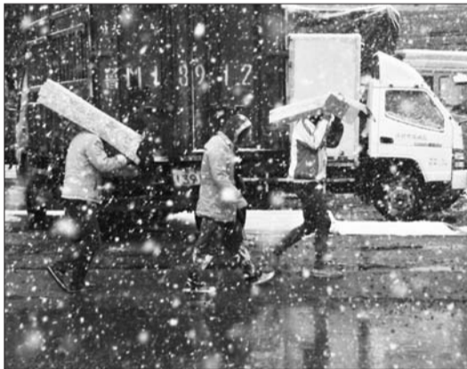
雪越下越大,几位市民顶着纸箱抵挡风雪。

本周前三天,受高空槽影响,滨州市云量较多,中午前后温度稍高,在20℃左右,最低温度也在8℃左右。只是周一当天滨州市大部分地区还是阴天,温度相对来说较低,最高温在19℃,最低温在6℃。