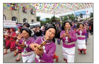
摸你黑狂欢节上的芦笙队

沧源佤族自治县位于云南省临沧地区西南部，这里独有的“摸你黑”节取名形象，意为佤族百姓用锅底灰、牛粪、泥土涂抹在额头上用以驱邪祈福求平安，并由此衍生出带有浓烈祝福色彩的大型民间节庆。 摸你黑狂欢节被评为云南省最具魅力和影响力的“十大民族节庆”之一。节日上，人们互相涂抹用纯天然药物配成的涂料，为