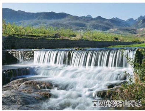
艾崮桃源好山好水