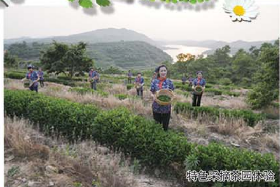
特色采摘茶园体验