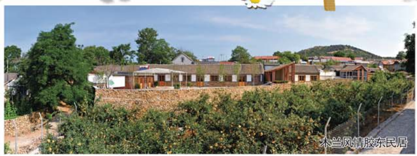
木兰风情胶东民居

如今，历经四季更迭，结出了第一枝饱满的果实。首批10个“美丽乡村”正在仙风海韵中徐徐绽放，无论是魅力独具的木兰风情还是如诗如画的金山胜景，无论是绿野闲园的开心农场还是黄金河畔的度假山庄，无一不是天人合一的妙美佳作，更是您“五一”小长假春游踏青的好去处。