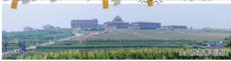
金山胜景葡萄酒庄