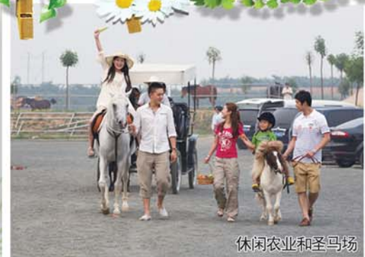
休闲农业和圣马场