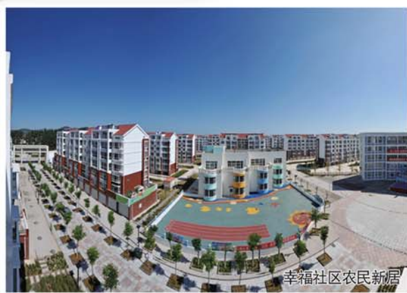
幸福社区农民新居