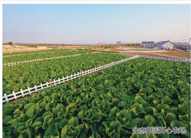
生态田园开心农场