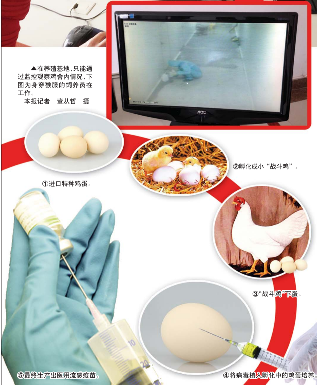
流感疫苗生产流程示意图

“这些鸡经常要体检,它们的体检要进行抽血等等,和人类一样,抽血之前需要空腹一段时间才行。这些严格的措施无非是保证这些鸡体内无菌无毒,所产的蛋纯净无污染,成为生产疫苗的绝佳培养基。”