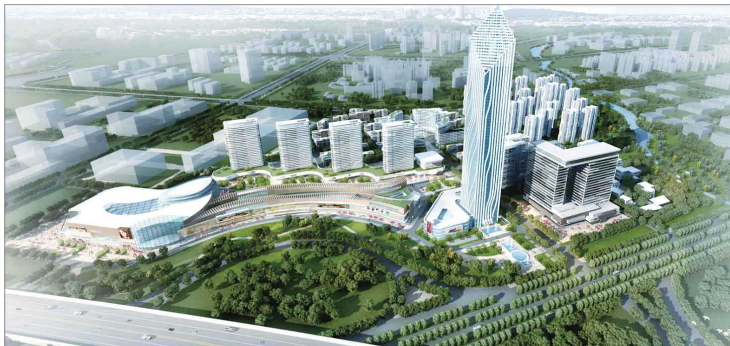
烟台业达科技园效果图