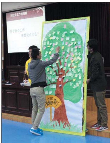
一次活动上,同学们在“天使之家”的幸福树上留下祝福。

天使之家的行动不仅让人们更加了解社工这个职业,也让越来越多的人加入到了社工的行列。