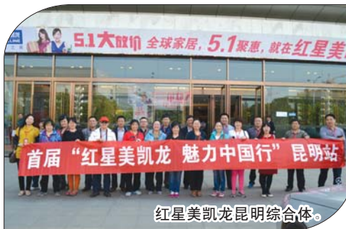
红星美凯龙昆明综合体。