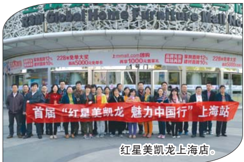
红星美凯龙上海店。

了家居MALL、百货MALL,城市级商业步行街、甲级及超甲级写字楼、五星级酒店和双景园林、生态豪宅、精品公寓等丰富业态,缔造了德州商业中心、CBD高档商务中心、文化娱乐中心、休闲美食中心、展览展示中心及高品质居住中心,成为德州新的城市地标和崭新名片。