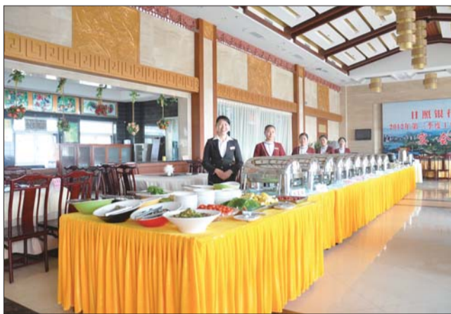
飞天宾馆宴会厅内景。

距离“五一”小长假还有不足一周的时间,飞天宾馆即将迎来营运高峰期。记者了解到,飞天宾馆创意性地采用了灵活机动的用餐标准选择制度,所有客房实行4-6折优惠。