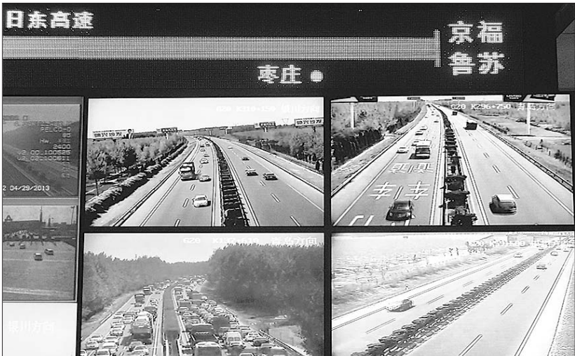
29日上午,山东高速监控中心显示,高速局部路段因为事故发生拥堵。

山东高速股份一位工作人员告诉记者,小长假高速免费,全民乐享免费政策,导致大量私家车扎堆涌进高速公路,这增加了刮擦追尾的发生概率。而且“五一”不同于春节,很多大货车依然在路上跑,客货混流的情况更易造成交通事故。而高速公路上的局部拥堵,大都是由交通事故引起的。