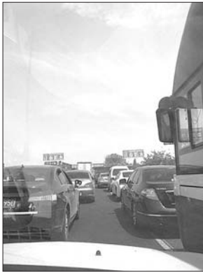
29日上午,济青高速部分路段大拥堵。

博到临淄段只有十八九公里的路程,足足走了3个小时。刚开始是走走停停,后来还经历了两次停车不动的情况。行至距离临淄收费站四五公里处时,记者看到,一辆货车横在高速路上,地上满是玻璃碎碴,旁边一辆灰色轿车的车头已经严重变形,救援人员正在用救援车辆将事故车辆拖离现场。从济南到临淄,不到150公里的路程,平时只用一个半小时的时间就可到达,但这次却整整用了6个小时。记者通行的一路上,除了这两起较大的交通事故外,还看到了多起小刮擦事故。本报记者 王倩 崔岩