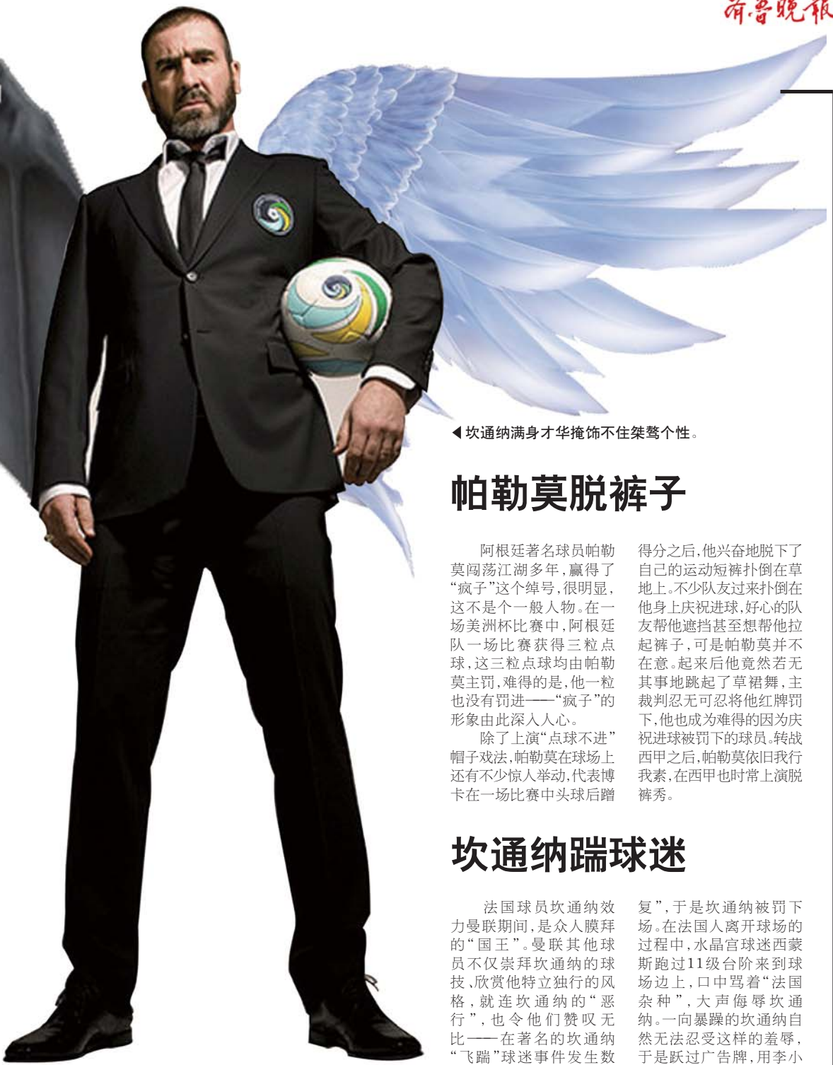
◀坎通纳满身才华掩饰不住桀骜个性。

在布宜诺斯艾利斯省莫雷诺市近郊他的别墅门口,用小口径气步枪打伤了前来采访的4名记者。此后,这4名受害者向法院控告了马拉多纳。2002年,这桩拖了8年之久的案子终于得到判决,法院在事实上还是向“球王”低头了,这一著名争议事件以马拉多纳被判处有期徒刑2年,缓期2年执行而告终。