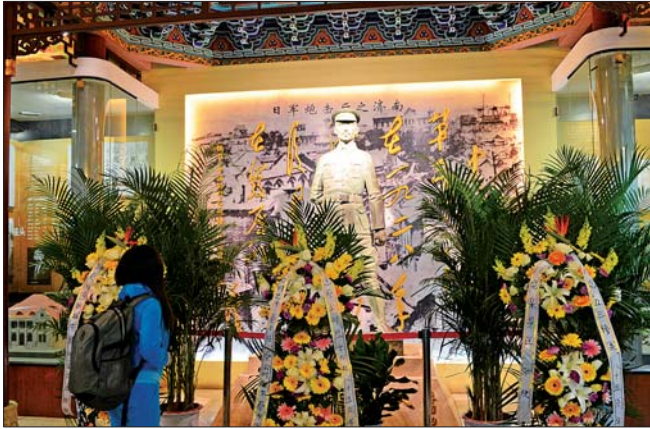
五三惨案纪念馆中的蔡公时烈士铜像。