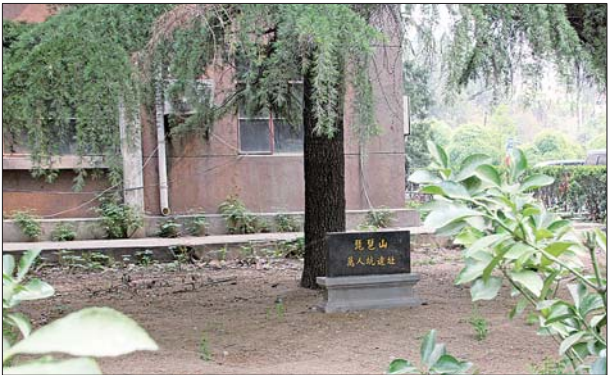
绿树掩映下，“万人坑”遗址碑很难被发现。