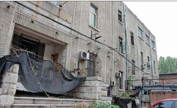
侵华日军细菌部队原驻地被列为文物保护单位。

据济南试金集团员工吕先生介绍，平时纪念碑和遗址碑处十分冷清，只在清明节时，会有一些市民前往祭奠。