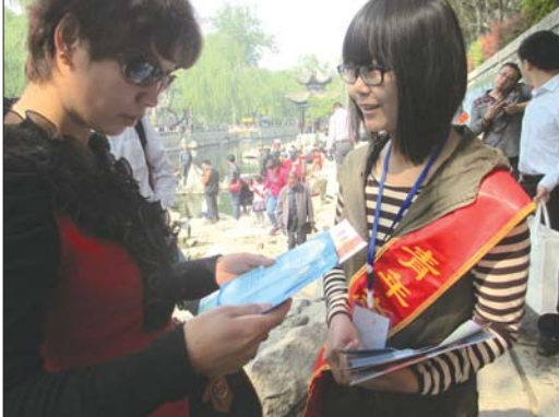
4日,节水志愿者走进环城公园向市民和游客介绍节水环保小知识。