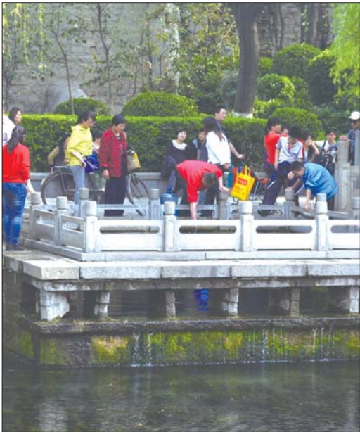
4日,玛瑙泉喷涌量明显减少,市民打水比以前吃力多了。

目前,济南市水利部门已采取措施加大限采、控采地下水力度,卧虎山水库也已经开溢洪闸放水,启动了应急补源措施,确保泉水持续喷涌。