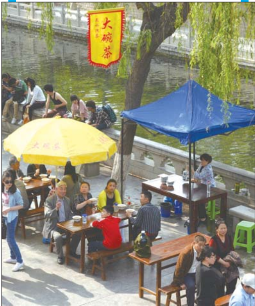
4日,黑虎泉畔重新摆上大碗茶摊位,每碗茶售价2元。