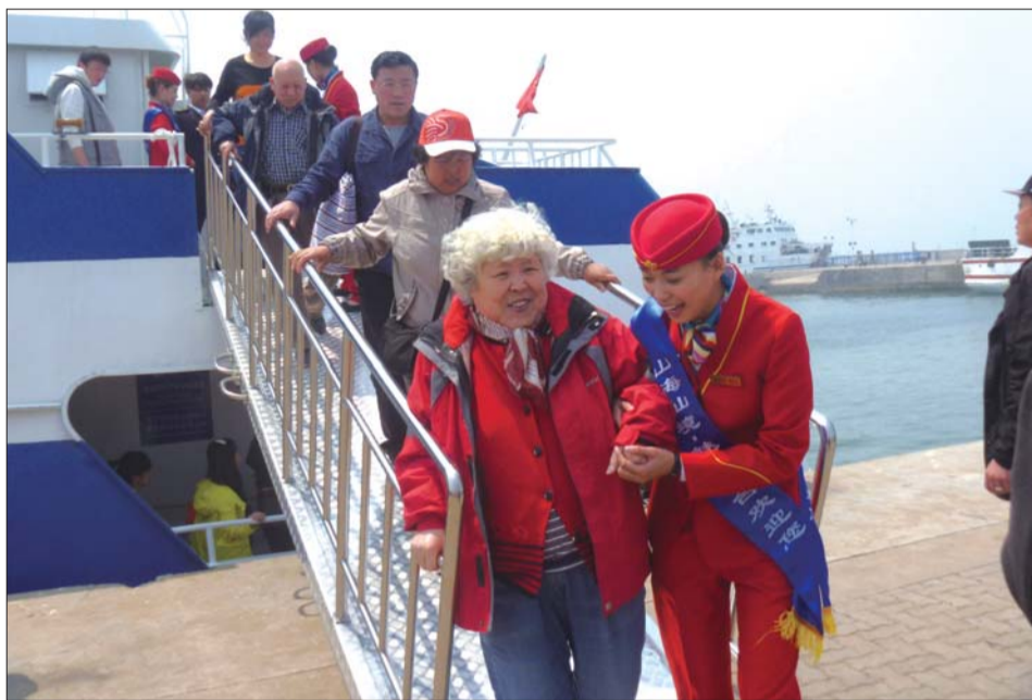
游客通过新绎一号登上长岛。

一些市民建议,游船的旅途时间短了,能不能在游船上放置一些娱乐设施,让他们感到更休闲。对此,李书宝回应,以后可能会向市港务局申请,能在旅途中多停留一点时间,让游客走出船舱,到甲板上领略周围风光。