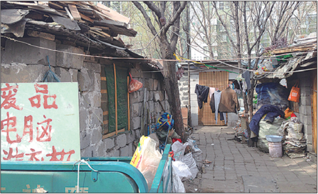
拾荒者聚居区内景。(摄于4月初)

晚上近8点，记者沿路从丁家庄走到这片区域，路旁都没有路灯，看不清道路，远远望去漆黑一片。整个区域都静悄悄的，只有偶尔几声狗叫，依稀能看到每家的电灯亮着，还有一户正在院子里用蜂窝煤炉子烧水，院子里也没有电灯。