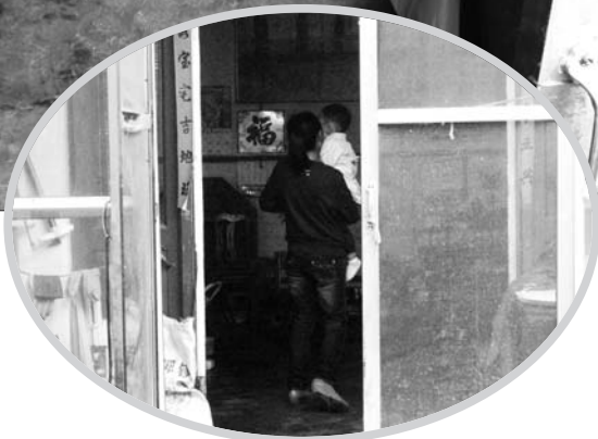
►事情发生后,女孩经常哭闹,情绪很不稳定。