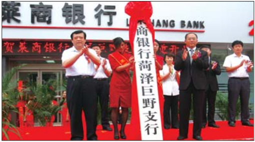
2012年9月26日,莱商银行菏泽巨野支行隆重开业。