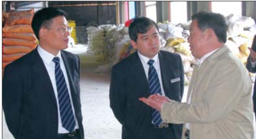
工作人员实地考察企业生产经营情况