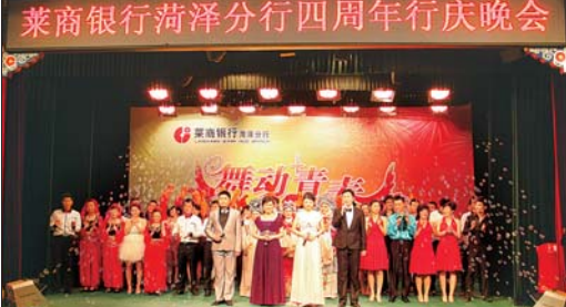
举办莱商银行菏泽分行行庆晚会