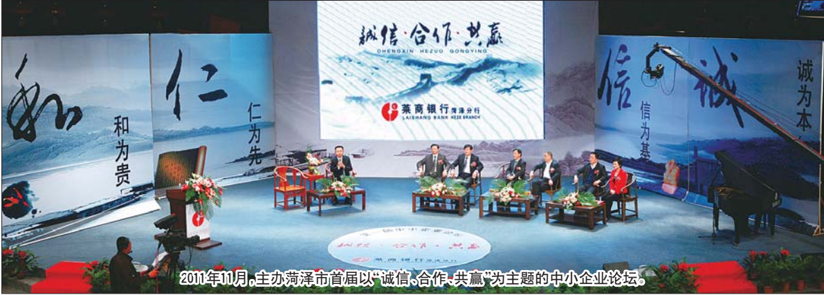
2011年10月,主办菏泽市首届以“诚信、合作、共赢”为主题的中小企业论坛。

莱商银行成立于2005年7月,是一家公司治理完善的股份制商业银行。多年来,莱商银行坚持走差异化、特色化发展之路,实现了稳健、快速发展,机构设置达5省11地市。截至2012年末,莱商银行各项存款余额达到279.3亿元,各项贷款余额达到184.4亿元,实现利润总额8.11亿元,缴纳各种税金3.9亿元,资产总额一举突破400亿元,自2010年以来三年翻了一番,发展模式越来越成熟,发展空间越来越广阔,抵御风险能力越来越强。良好的经营业绩使莱商银行的社会公信力不断提升,先后被授予“全国五一劳动奖状”、“全国守合同重信用企业”、“省级文明单位”、“中国银行业文明规范服务示范单位”等荣誉称号,在英国《银行家》杂志评选的全球性银行1000强中排名第705