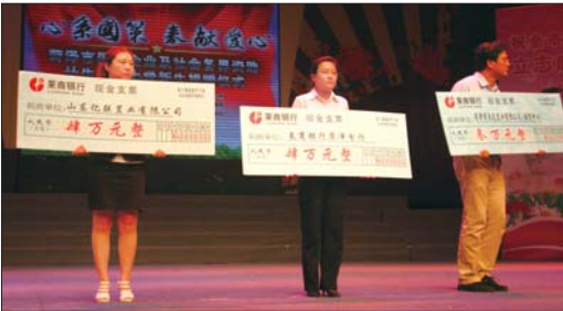
向菏泽贫困大学生捐款