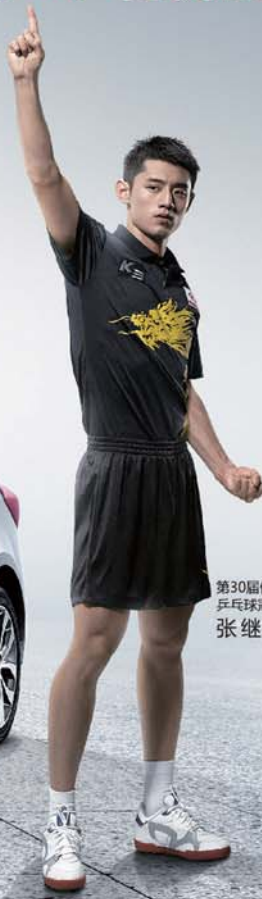
第30届伦敦奥运会 乒乓球冠军 张继科