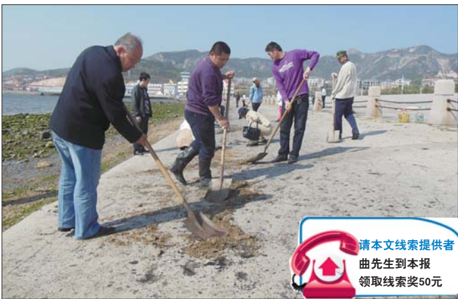
工作人员在西海岸清理黑色的油污。

芝罘区海洋与渔业局海域管理科科长郝女士说,由于担心化学制剂对附近海域造成二次污染,目前还没有好的办法,只能用沙土进行初步清理。目前情况已经汇报给烟台市海洋与渔业局和芝罘区政府,期待进一步的回应。本报也将对此事进行持续关注。