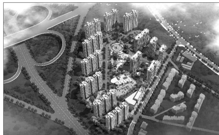
文昌路318号保障房规划示意图。

本报5月12日讯(记者 邱晓宇) 近日,李沧区文昌路318号地块建设规划方案出炉。该地块将建可满足1382户居民居住的高层住宅,以及幼儿园、卫生服务站等各项生活服务设施。