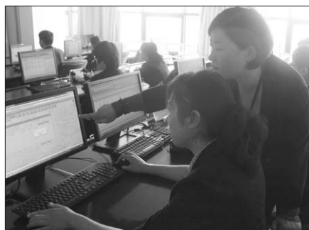
12日,工作人员正在对市民的投诉进行处理。

通过网上在线方式。市民可登录市南政务网,打开市南区城市管理网络全民互动服务平台进行事件的投诉举报。