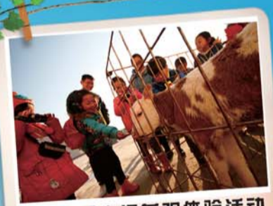
奶牛场参观体验活动