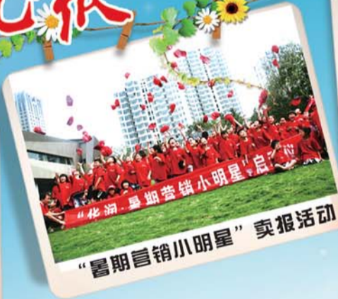
“暑期营销小明星”卖报活动