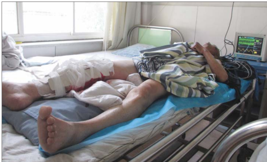
老人伤情严重,躺在医院。

“快截住他,让他停下。”正在路边打牌的几位老人见此情景,跑到马路上,想要将逃逸的司机给拦截下。但由于汽车的车速太快,老人们的拦截没有成功。据当时拦车的一位市民说,老人被撞