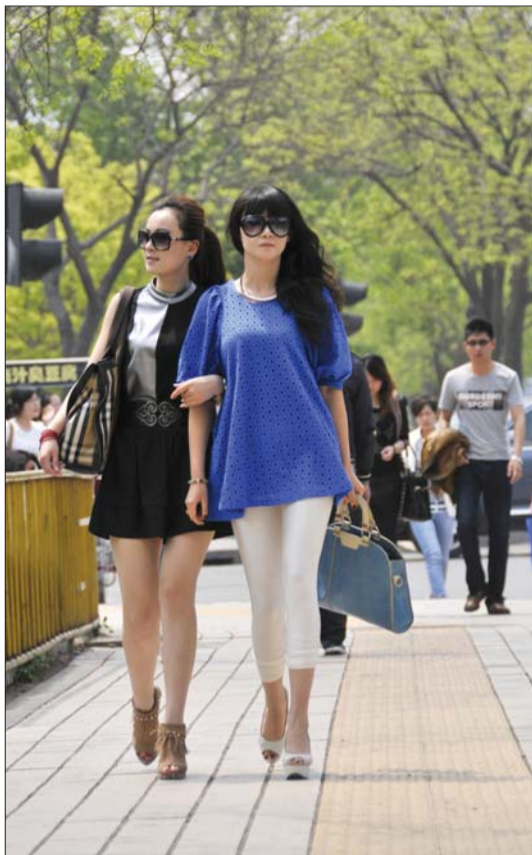
12日,由于气温升到35℃,很多市民都已经换上了清凉的夏装。