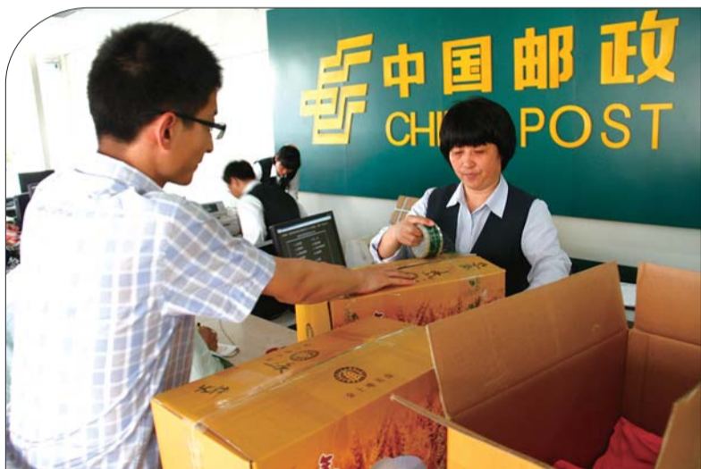
在邮局工作人员帮助下,本报募集的新衣服被打包完毕。