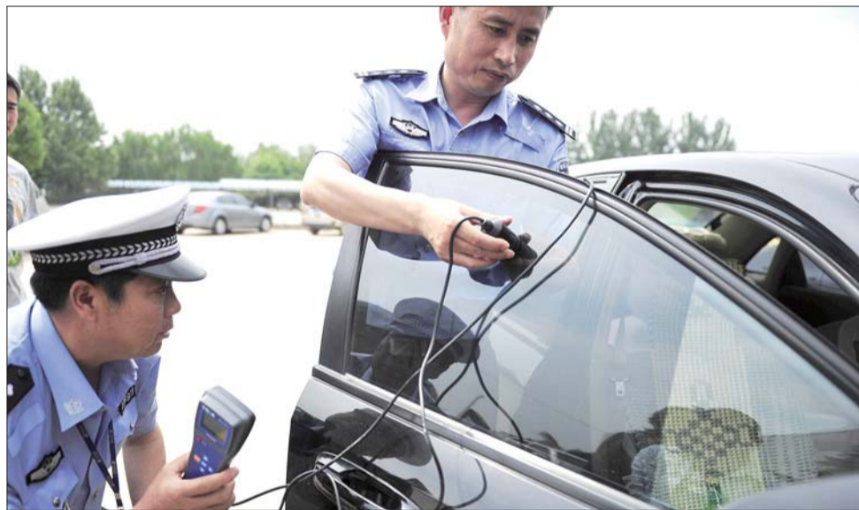
17日,在华润检测线,槐荫车管所民警正在用透光率计检测车辆车膜的透亮度。

夏天到了,不少车主为了隔热,选择给爱车贴膜。可贴膜后去车审又总是不过关。什么样的车膜才符合标准?16日,记者探访了槐荫区车管所,民警介绍,车膜的透光率必须达到70%。