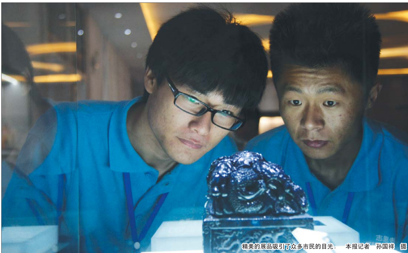
精美的展品吸引了众多市民的目光。