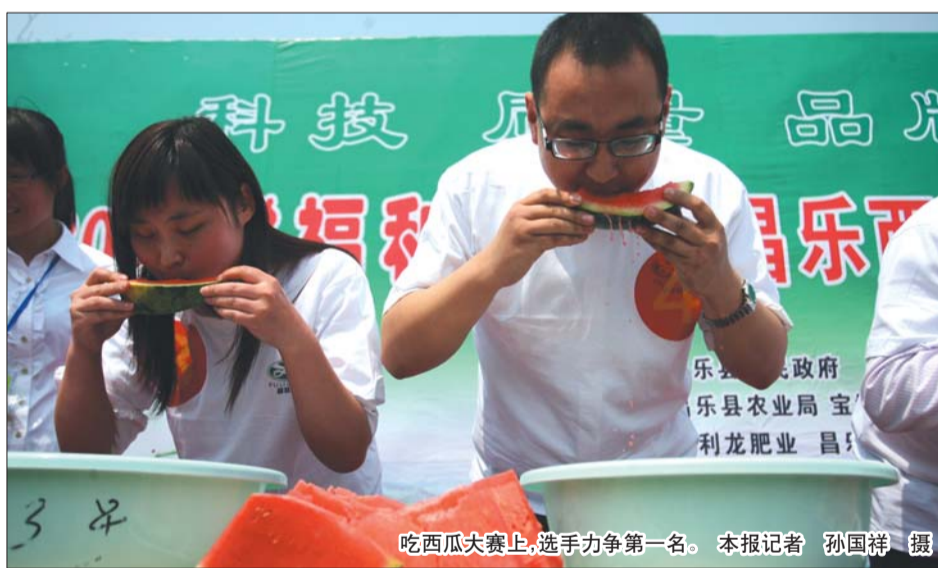
吃西瓜大赛上,选手力争第一名。