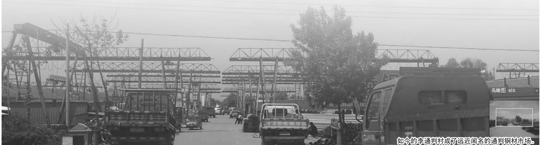
如今的李通判村成了远近闻名的通判钢材市场。

村民介绍,40多年前,通判村勤劳的人们曾不辞辛苦骑着自行车去天津拉钢材,发展到现在的初见规模,如果要写成诗词,肯定又是另一番味道罢。