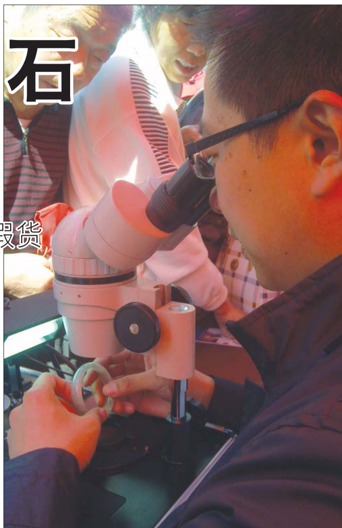
鉴定师正在为市民鉴定玉镯。