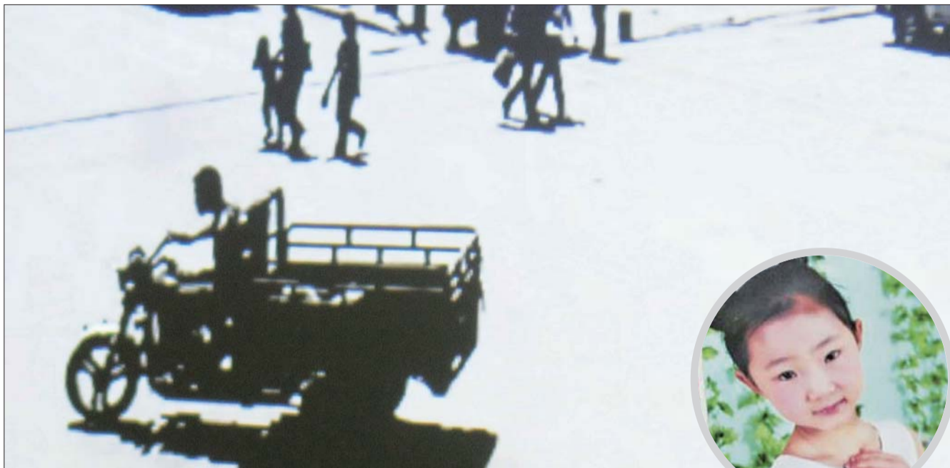
12日,徐某在光天化日之下,用一辆摩托三轮车将小艾钰带走。(视频截图) 本报记者 王鸿光 摄

5月21日中午,专案组民警在南侯村附近山中将尸体找到。至此,案件成功告破,目前案件侦查工作正在进行中。